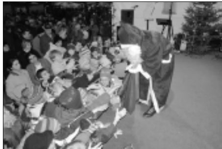
Der Nikolaus verteilt Geschenke

Für kulturelle Beiträge sorgten unter anderem die Entertainerin Regina Thoss, sowie der Gospel-Chor de Großröhrsdorfer Gymnasiums.