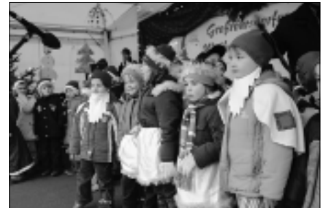
Auftritt der Kinder aus der Kita