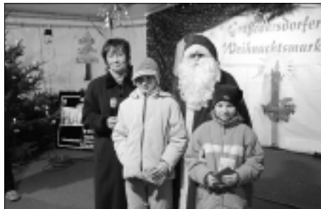
Zwei der Gewinner des Kinderrätsels

Wir möchten uns bei allen Händlern, Vereinen, kulturellen Veranstaltern und Gästen recht herzlich für die beiden tollen Tage bedanken!