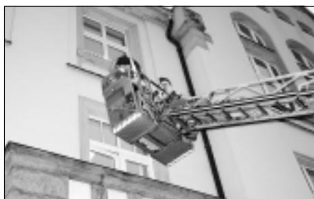
Rettung des Nikolaus vom Rathausbalkon

leider nur zwei anwesend. Sie konnten ihren Gutschein sofort mit nach Hause nehmen. Die anderen Gewinner erhalten in den nächsten Tagen ihren Gutschein mit der Post.