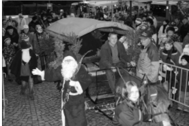
Ankunft des Nikolaus am Sonnabend