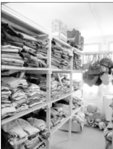
Neben Kleidungsstücken gibt es auch zum Beispiel Rucksäcke und Plüschtiere

In der Kleiderkammer in Großröhrsdorf gibt es nicht nur Sachen, sondern auch unter anderem Geschirr, Kinderwagen und Plüschtiere günstig zu erwerben. Der Verein „Arbeitslosen-Selbsthilfe – Landkreis Kamenz e.V.“ sammelt durch Kleidercontainer Spenden ein und verteilt diese wieder an Ausgabestellen, wie in Großröhrsdorf. Hier kann nun jeder für zum Beispiel 1,50 Euro eine Jeans für Erwachsene erwerben. Aber auch die Preise von anderen Kleidungsstücken sind sehr niedrig: für Erwachsene ist das teuerste Stück eine Regenjacke für 5,00 Euro und Kinderbekleidung kostet maximal 1,50 Euro.