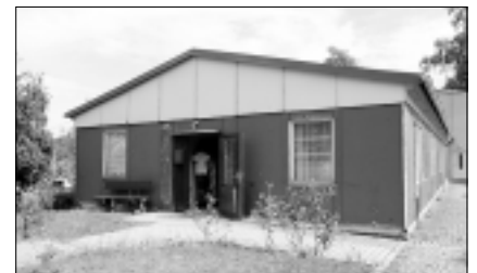
Die Kleiderkammer ist auf der Schillerstraße 7 zu finden

Aber die geringen Preise stehen nicht für eine mindere Qualität. Die gespendeten Sachen werden vor der Weitergabe aussortiert und gereinigt. So kommt es schon mal vor, dass mancher Besucher der Kleiderkammer sein Gekauftes kaum mehr tragen kann, da es so viel geworden ist.