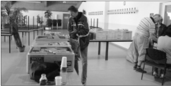
Mitarbeiter der Radeberger Tafel beim Verteilen der Lebensmittel

„Jeder gibt, was er kann“ – das ist das Motto der Tafel. Ehrenamtliche Helfer sammeln bei Supermärkten, Bäckereien oder Wochenmärkten Lebensmittelspenden ein und verteilen sie an Bedürftige. 33 Tafeln gibt es in ganz Sachsen.