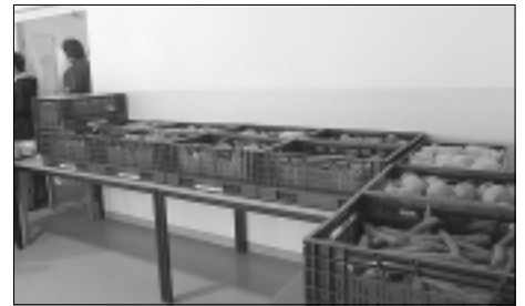
Obst- und Gemüseauswahl

zu erhalten. Die Mitarbeiter der Radeberger Tafel versuchen anhand der Familienmitglieder die eingegangenen Spenden gerecht zu verteilen. Was oftmals nicht so einfach ist! Einerseits steigt die Nachfrage für eine derartige Unterstützung