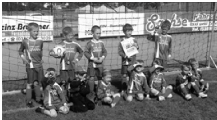
FSV Bretnig-Hauswalde spielte mit:

Beim 1. G-Jugend Turnier in Großröhrsdorf im Rahmen des Einigkeitsfestes 2009 belegten die jüngsten Fußballer des FSV einen ausgezeichneten 2. Platz.