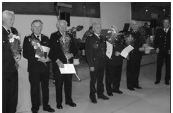
Kameraden des Ortsverbandes Rödertal-Pulsnitz nach ihrer Auszeichnung zum 50jährigen Dienstjubiläum