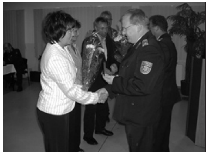
Glückwünsche der Bürgermeister des Ortsverbandes an ausgezeichnete Kameraden