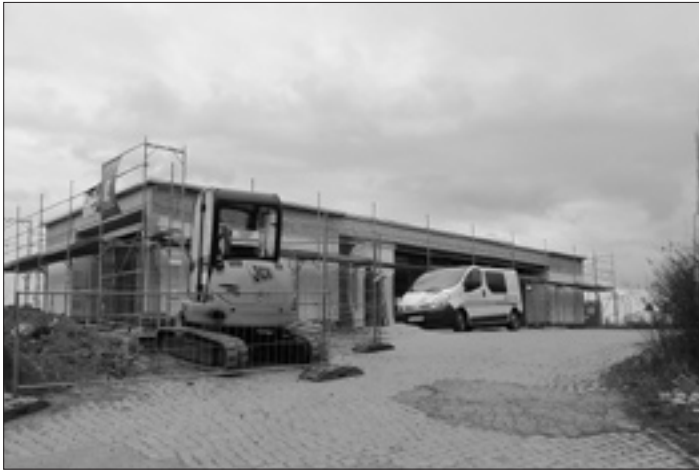
Der Neubau des Gemeindezentrums an der Festwiese von Kleinröhrsdorf

Am 1. Oktober 2009 fand der Spatenstich für das neue Gemeindezentrum für Kleinröhrsdorf statt. Im Jahr 2009 konnte der Rohbau noch durch ein Dach geschlossen werden, bevor der einsetzende Winter zu einer Unterbrechung der Bautätigkeit zwang.