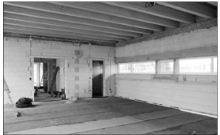
Der Mehrzweckraum im Inneren des Gebäudes

In dem neuen Gebäude soll ein Mehrzweckraum entstehen, der Vereinen und Privatpersonen aus Kleinröhrsdorf als Möglichkeit für Treffen sowie Festivitäten dienen soll. Neben diesem Raum stehen den Nutzern eine Küche sowie ein Sanitärbereich mit behindertengerechter Toilette zur Verfügung. Auch soll in dem neuen Gebäude ein Büro für den Ortsvorsteher entstehen, in dem gleichfalls die Sitzungen des Ortschaftsrates stattfinden sollen. Weiterhin befindet sich in diesem Gebäude ein Abstellraum, wo zum Beispiel Tisch- und Sitzgarnituren für Veranstaltungen auf der Festwiese aufbewahrt werden können.