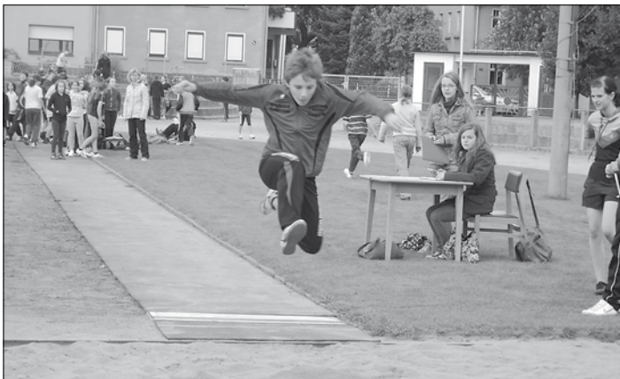
Erste Flugversuche beim Weitsprung

Am 8. September 2010 fand unser diesjähriges Sportfest statt. Die Klassen 5 bis 10 wetteiferten in verschiedenen Disziplinen um den Sieg bei kühlen Temperaturen, aber bei strahlendem Sonnenschein! Die Tanzmäuse der 5. Klassen eröffneten den Tag um 7:30 Uhr und um 8 Uhr gingen die ersten Wettkämpfe los.