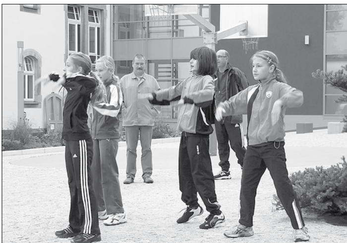
Die Tanzmäuse der 5. Klasse eröffnen das Sportfest

Die Schüler absolvierten einen leichtathletischen Dreikampf (Sprung, Sprint, Schlagball/Kugelstoßen). Die Werte bei den einzelnen Stationen gehen mit in die Sportbenotung ein. Deshalb strengten sich heute alle besonders an. Außerdem wurden Volleyball-, Fußball- und Zweifelderballturniere veranstaltet. Hier konnten die Mädchen und Jungen ihren Teamgeist unter Beweis stellen und die jahrgangsbeste Mannschaft wurde ermittelt.