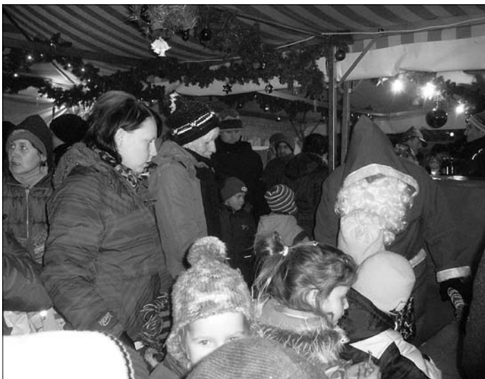
Der Nikolaus verteilt die gefüllten Stiefel im Zelt des Vereins Einigkeit e.V.

Auch zur Verteilung der gefüllten Stiefel im Zelt des Vereins „Einigkeit“ e.V. hatte sich der Nikolaus am Sonntag angemeldet und ließ sich von jedem Kind ein kleines Gedicht oder Lied vortragen.