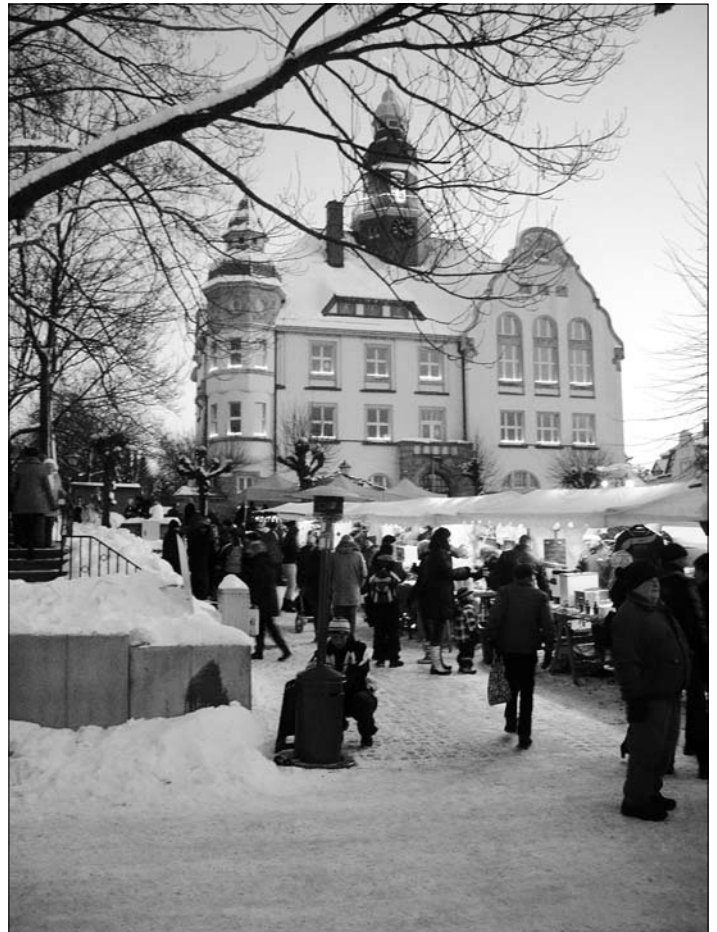
Weihnachtliches Flair vor dem Rathaus