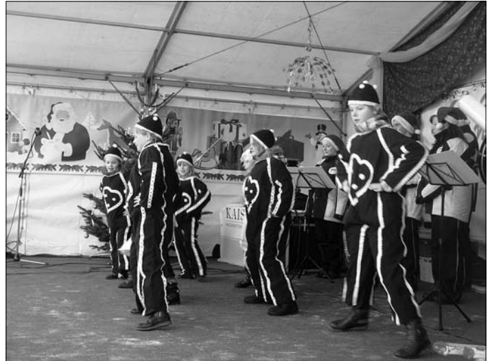
Die Pulsnitzer Krümel auf der Bühne vor dem Rathaus