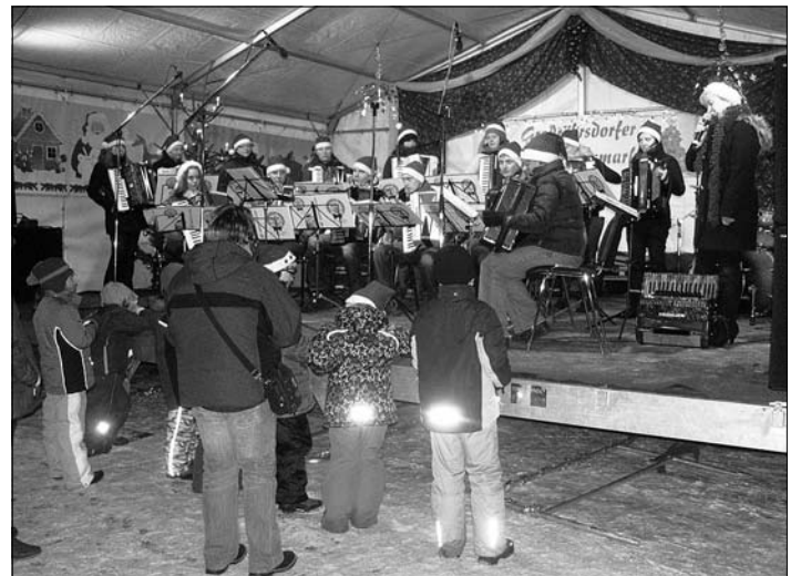
Das Akkordeon-Orchester Harmony Dreams stimmte alle weihnachtlich ein.

Für kulturelle Beiträge auf der Bühne vor dem Rathaus sorgten unter anderem am Samstag die Kinder der Kindertagesstätten „Agnesheim“ und „Waldhäuschen“. Sie nahmen die Zuschauer mit einstudierten Liedern und Gedichten auf eine Reise durch den Advent mit. Aber auch das Kinderweihnachtsprogramm „Die Weihnachtsgans Auguste“ und das Konzert des Akkordeon-Orchester „Harmony Dreams“ der Musikschule Fröhlich bannten viele Zuhörer vor der Bühne.