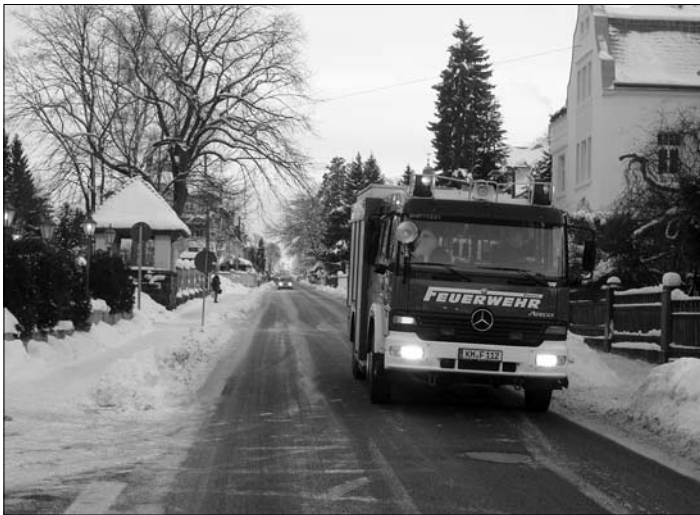
Am Samstag reiste der Nikolaus mit der Feuerwehr an.

Wie in jedem Jahr fand am 2. Adventswochenende in Grob- / Bretnig-Hauswalde der Weihnachtsmarkt mit Nikolauseinzug statt. Bei zwar kalten Temperaturen ließen es sich viele Grob- / Bretnig-Hauswalder und Gäste nicht nehmen, am Samstag über den schneebedeckten Markt zu bummeln. Allerlei Köstlichkeiten aus Backofen und Grill, sowie Glühwein und ein buntes Programm wurden angeboten. Und auch wenn natürlich Pfefferkuchen und Glühwein besonders hoch in der Gunst der Besucher standen, waren alle Händler und Vereine recht zufrieden mit dem Geschäft.