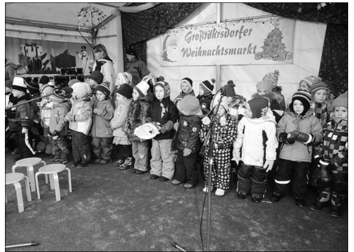
Auftritt der Kita Agnesheim und Kita Waldhäuschen