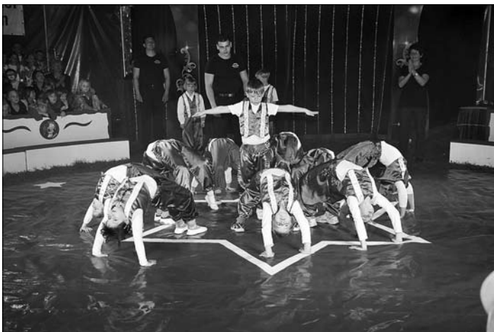
Sportlich zeigten sich die kleinen Akrobaten entweder am Boden oder in luftiger Höhe.

Die Zuschauer kamen aus dem Staunen gar nicht mehr heraus, als die Jongleure, Seiltänzerinnen, Akrobaten, Zauberer, Fakire, Piraten, Dressseure und Trapezkünstlerinnen ihr Können präsentierten.