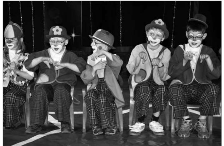
Eine ganze Schar von Clowns brachte das Publikum zum Lachen,

Besonders beliebt waren die Clowns, die mit viel Schauspielkunst das Publikum zum Lachen brachten. Zum Lohn erhielten all unsere kleinen Künstler viel, viel Applaus.