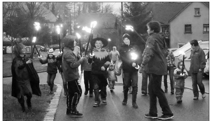
Kleine Hexen, Teufelchen und Ungeheuer trotzten dem Regen und der Kälte und kamen zum traditionellen Fackelumzug nach Hauswalde. Ziel war der Hexenfeuerhaufen vor der ehemaligen Schule in Hauswalde.

Auch wenn dieses Feuer an Größe mit denen der letzten Jahre zuvor nicht mehr zu vergleichen war, so kamen wieder Einwohner des Ortes zusammen, um bei einem Bier, einer Bratwurst oder einem Becher Sekt