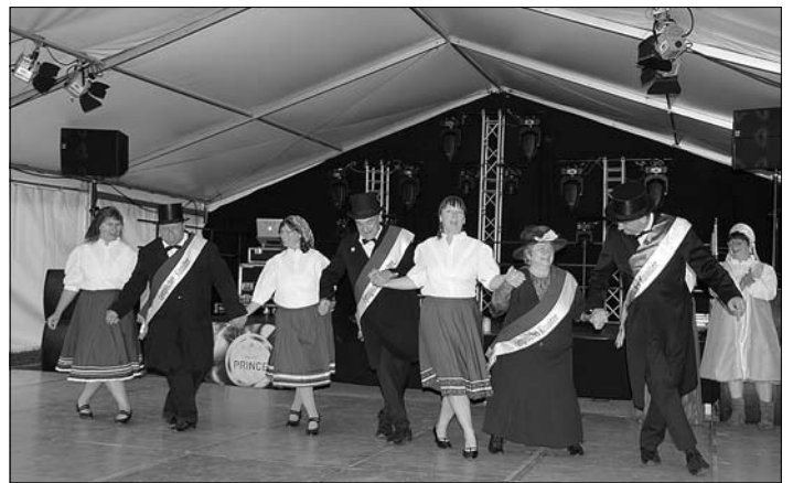
Das Lypmische Komitee der Fischbacher Kirmes

21 Punkte umfasste allein das Samstagsprogramm und die Kinder waren am Ende mit der Befüllung der Klassenkassen ganz zufrieden. Beim Wettschießen mit der Abordnung der „Fischbacher Girmsd“ beim Empfang des lypmischen Komitees siegte Bretinig knapp mit einem Punkt