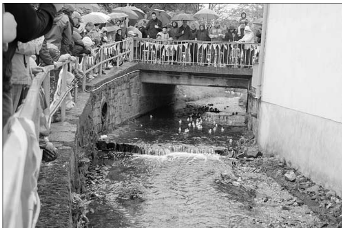
Volle Ränge zum Entenrennen