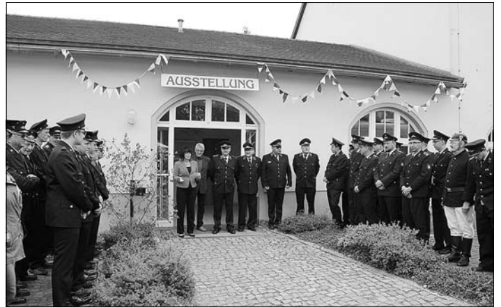
Eröffnung der Feuerwehr-Ausstellung

ihre Klassenkassen auszufüllen. Ebenso war der ASB-Kindergarten Schlumpfenland mit der Präsentation der Projektarbeit auf dem Platz.