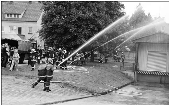
Stolz präsentierten die Jugendfeuerwehren des Ortsverbandes Rödertal ihr Können.

Nur drei Programmpunkte fielen dem Wetter und den Platzbedingungen zum Opfer. Ein Highlight an diesem Tag war sicherlich 13.30 Uhr die Übung der Jugendfeuerwehren des Ortsverbandes Rödertal und Umgebung mit ca. 80 Kindern!