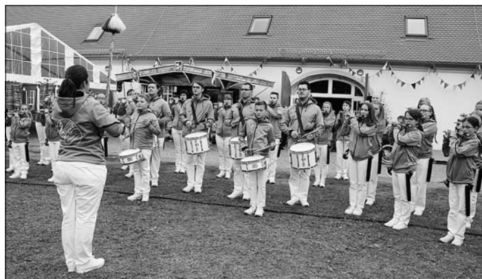
Auftritt des Spielmannszuges Kleinröhrsdorf

Am Kirmes-Montag fanden traditionell die letzten Spiele der Kirmes-Fußball-Wettkämpfe auf dem Sportplatz statt. Zum ersten Mal gab es an diesem Tag ein Fußball-Turnier Ü70 und startete 16.30 Uhr mit zwei Dresdner und zwei Oberlausitzer Mannschaften. Die Fußballer aus dem Rödertal lagen dabei im guten Mittelfeld.