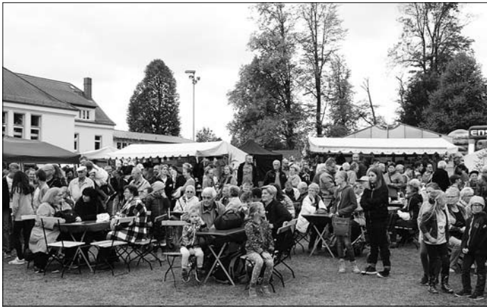
Zahlreiche Gäste besuchten die Kirmes.

„Jetzt waren wir wohl mal dran“ das war wohl der Ausspruch, der oft auf dem Kirmes-Platz am Wochenende zu hören war. Nach jahrelangem optimalem Kirmes-Wetter traf uns der Dauerregen am Samstagabend und am Sonntagmorgen hart und verwandelte den Kirmesplatz in eine Matsch-Fläche. Dank an alle, die uns kurzfristig mit Regen-Zelten und -Pavillons aus der Wetter-Not halfen.