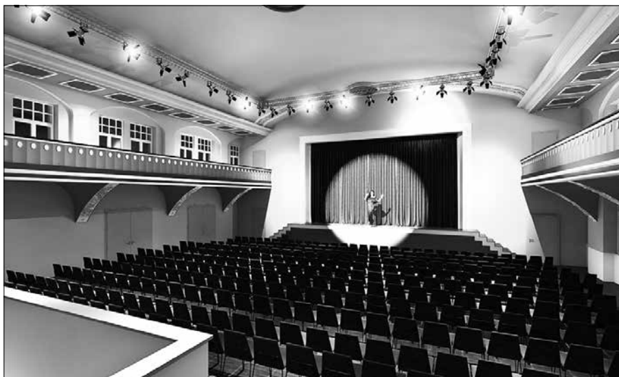
So soll der große Saal zukünftig aussehen.