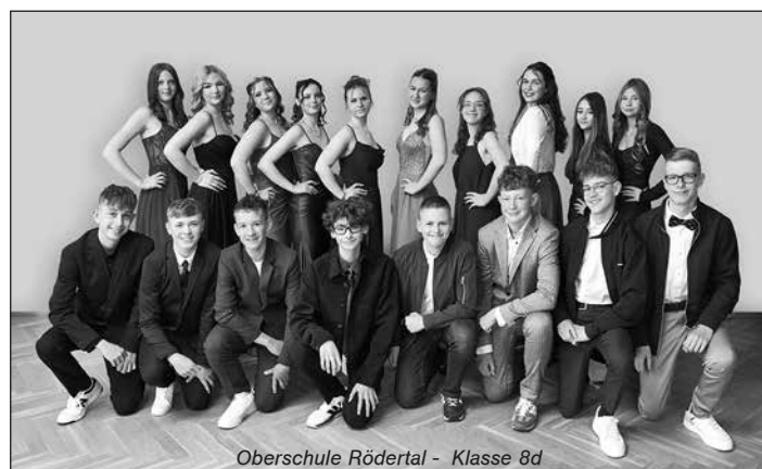
Oberschule Rödertal - Klasse 8d