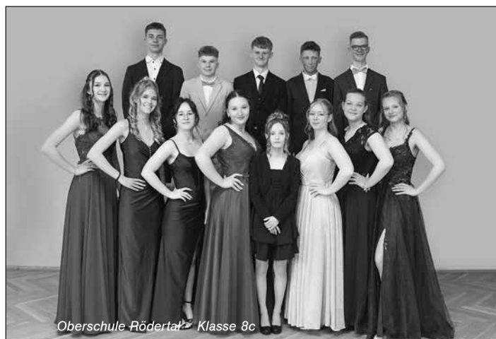
Oberschule Rödertal - Klasse 8c