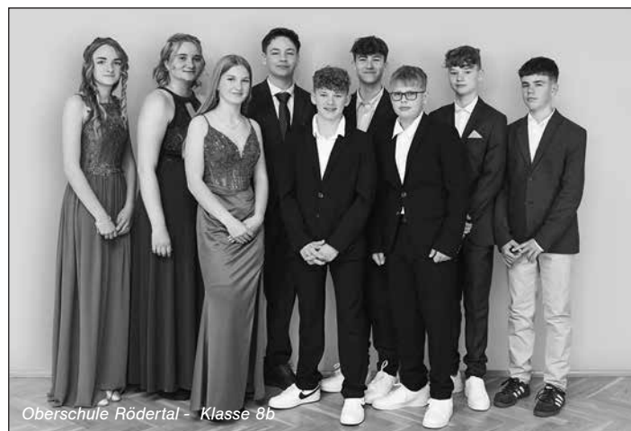
Oberschule Rödertal - Klasse 8b