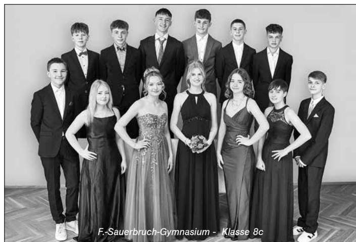
F-Sauerbruch-Gymnasium - Klasse 8c