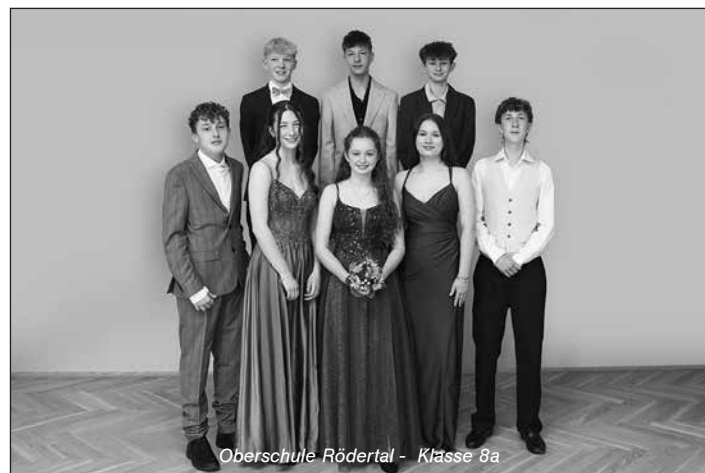
Oberschule Rödertal - Klasse 8a