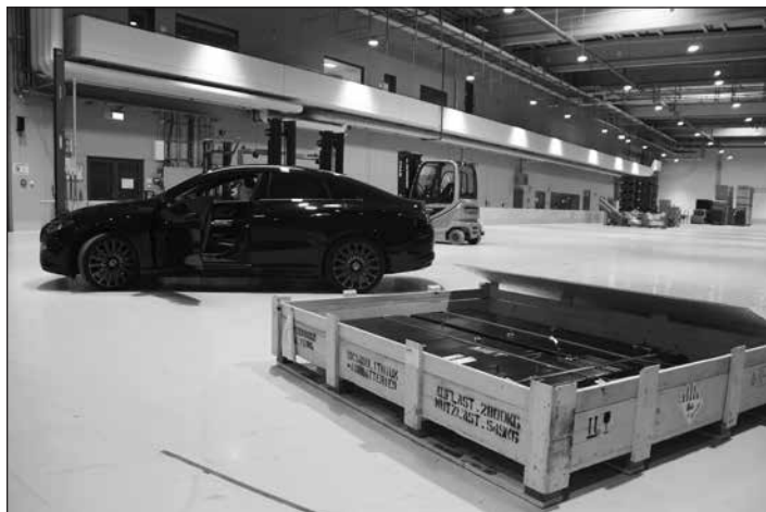
Eine Fahrzeugbatterie, die zunächst für den Einbau in einer C-Klasse bestimmt war.

Da die erste „Sommeredition“ des Firmen-Info-Treffens im vergangenen Jahr ein voller Erfolg war, organisierte die Stadt das beliebte Format auch in diesem Jahr im Frühsommer.