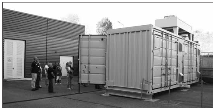
Je nach Kundenanforderung werden Container mit den Batteriemodulen bestückt.

Knapp 60 Gäste folgten am 28. Mai der Einladung der Mercedes-Benz Energy GmbH in die einstige Schüco-Halle zum Unternehmerstammtisch. Bei einer Führung durch Lager-, Prüf- und Servicebereich konnten sich die Besucher des Firmen-Info-Treffens zunächst über die Mercedes-Benz Energy GmbH und ihre Produkte informieren. Das ursprünglich aus der Accumotive GmbH & Co. KG entstandene Unternehmen ist seit Oktober 2024 in Großröhrsdorf ansässig. Es ermöglicht ausgedienten Fahrzeugbatterien ein zweites Leben als Energiespeicher. Damit verlängert das Unternehmen die Lebensdauer der Batterien deutlich und vermeidet ein vorzeitiges Recycling. Die standardisierten Batteriespeicherlösungen mit individueller Anpassbarkeit eignen sich für zahlreiche Anwendungen in Gewerbe und Industrie. Zudem sind sie skalierbar und leisten einen wichtigen Beitrag zu einer stabilen, flexiblen und umweltfreundlicheren Energieversorgung. Die Batteriespeicherlösungen von Mercedes-Benz Energy können Unternehmen dabei unterstützen, ihre Energie effizienter zu nutzen und Kosten zu senken. Ob zur Reduzierung von Lastspitzen, zur effizienteren Nutzung von Energie oder zur Sicherstellung einer stabilen Stromversorgung. Experten entwickeln dafür maßgeschneiderte Konzepte, die exakt auf die jeweiligen Bedürfnisse zugeschnitten sind. Zu diesem Zweck werden Container mit Batteriemodulen bestückt. Eine intelligente Steuerung sowie eine integrierte Kühlung sorgen dabei für Bestleistungen.